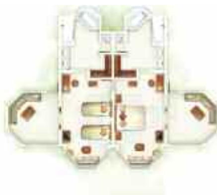
Suite Famille Family Suite